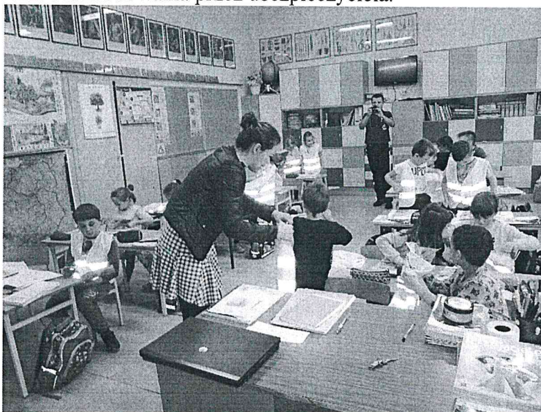
Przedstawiciele Placówki Terenowej KRUS w Wieruszowie wraz z funkcjonariuszem Policji na spotkaniu pt. „Tu jest bezpiecznie” w Szkole Podstawowej w Czastarach

Osoby nie przestrzegające przepisów dotyczących obowiązku noszenia odblasków poza terenem zabudowanym mogą zostać ukarane mandatem. Brak odblasków u poszkodowanego może być również uznany za przyczynienie się do zaistnienia wypadku i stanowić powód do odmowy wypłacenia odszkodowania przez ubezpieczyciela.